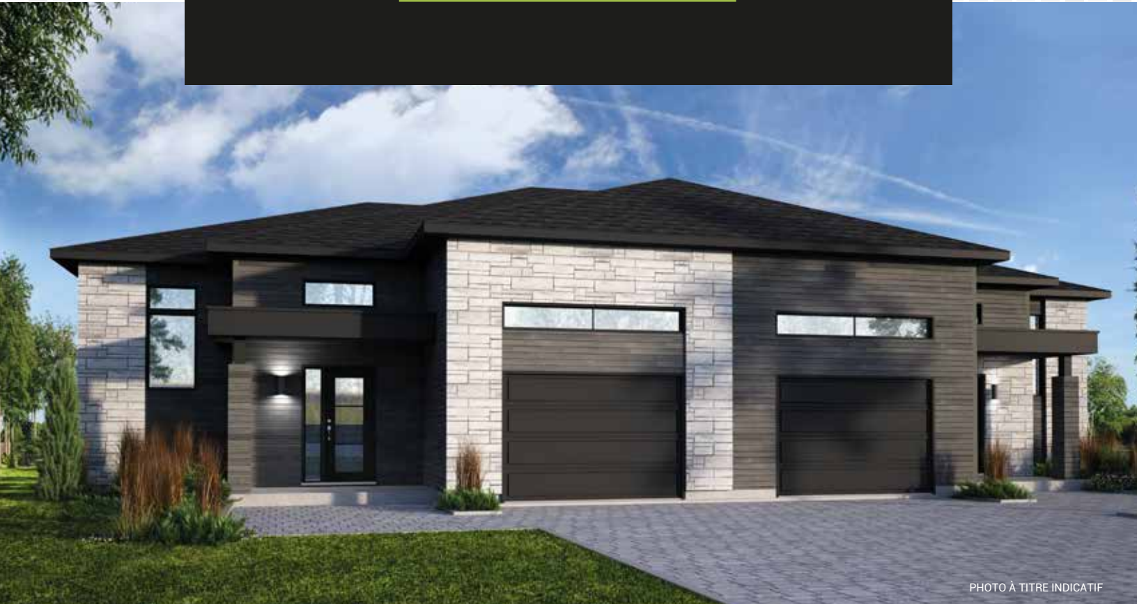
PHOTO À TITRE INDICATIF