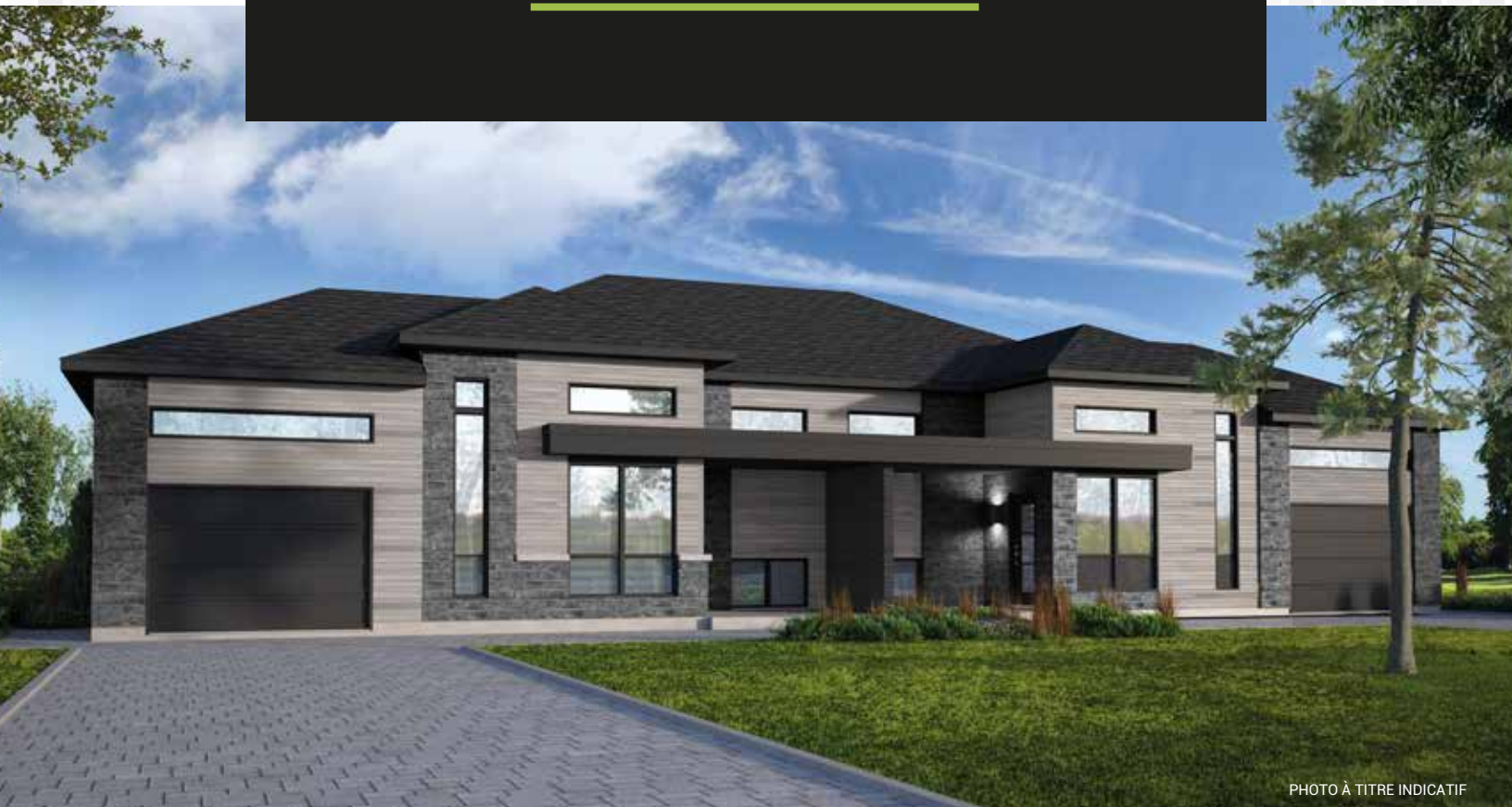
PHOTO À TITRE INDICATIF