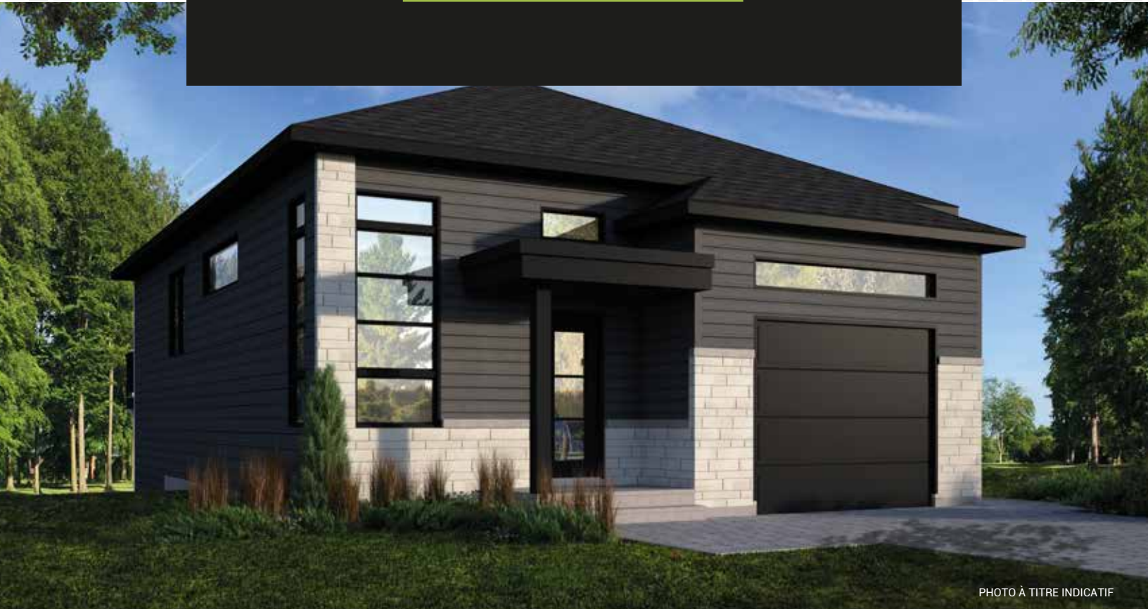
PHOTO À TITRE INDICATIF