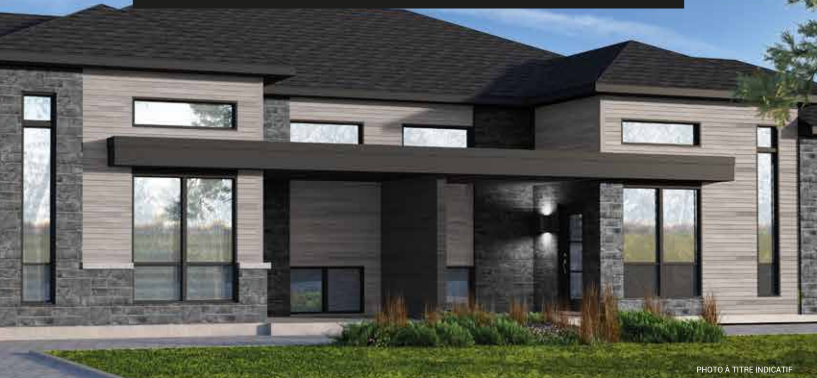
PHOTO À TITRE INDICATIF