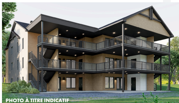
PHOTO À TITRE INDICATIF

Orford, c'est un mode de vie : la nature, l'air pur et une communauté chaleureuse... tout près de la ville!