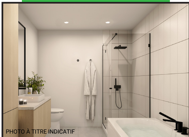
PHOTO À TITRE INDICATIF