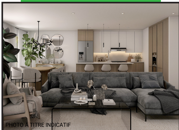
PHOTO À TITRE INDICATIF