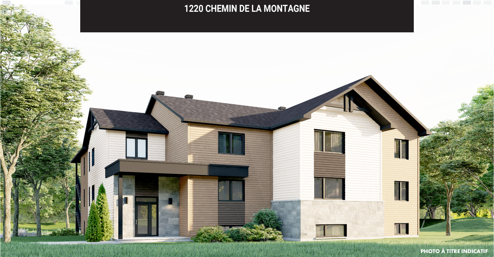
PHOTO À TITRE INDICATIF