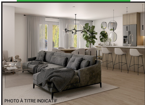
PHOTO À TITRE INDICATIF